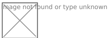
Рисунок 3- Организация процесса бюджетирования ООО «СтройСервис»

Как показано на рисунке 3 организация процесса бюджетирования на предприятии ООО «СтройСервис» происходит поэтапно.